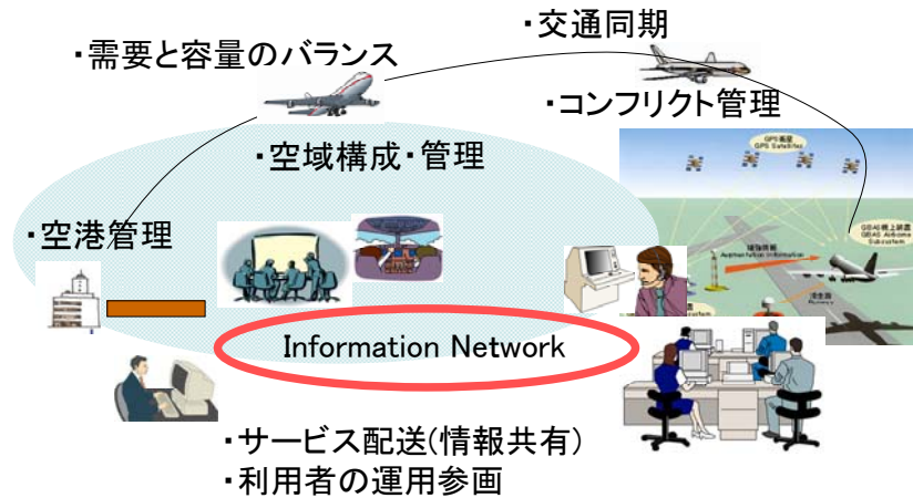
図 1 将来の全世界的 ATM の運用概念

電子航法研究所の研究長期ビジョンとしては図 1 に示すような航空交通管理のシステムを実現するために研究所として取り組むべき研究のビジョンを作成することとした。