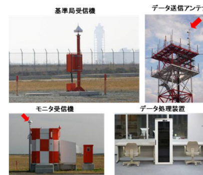
GBASプロトタイプ実験装置(関西国際空港)

空港に設置されるGBAS地上装置は、GPS衛星からの電波を受信する基準局受信機(4式)、航空機に送信する補強情報を生成するデータ処理装置、デジタル信号を送信するデータ送信装置から構成され、航空機には、GBAS機上装置(GLS:GNSS Landing System)が搭載される。