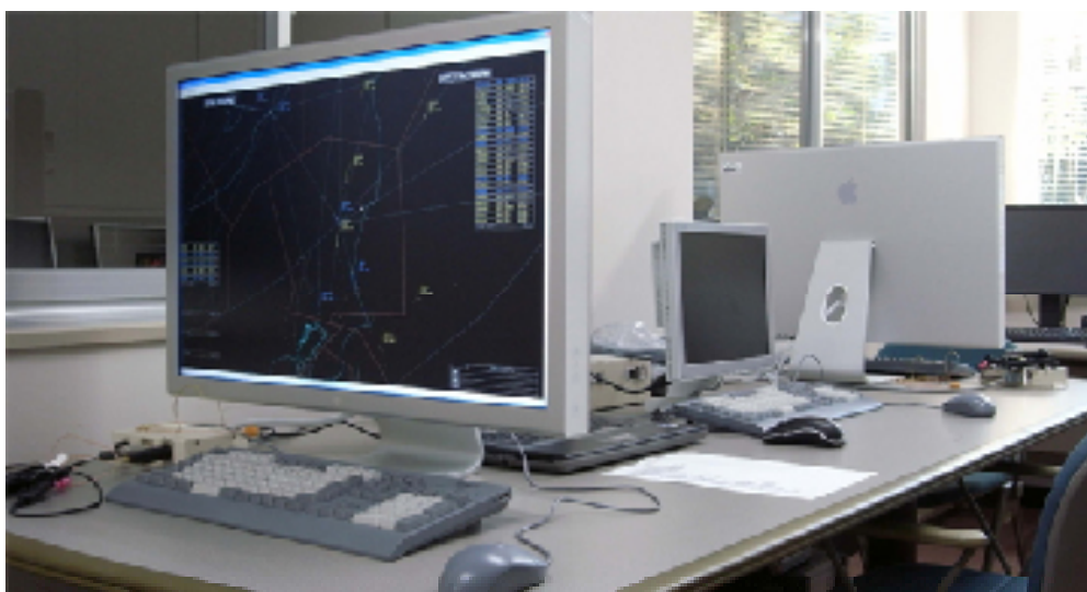
図 2 CPDLC 機能評価用航空路管制シミュレータの概観（手前が管制卓ディスプレイ）

最小限の機能にとどめた。図 3 に管制指示の一つである高度変更指示の CPDLC メッセージの入力手順を示す。